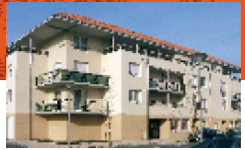
Le site de l'Île à la Meule