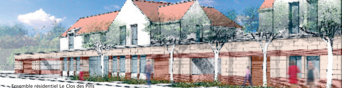
Ensemble résidentiel Le Clos des Pins